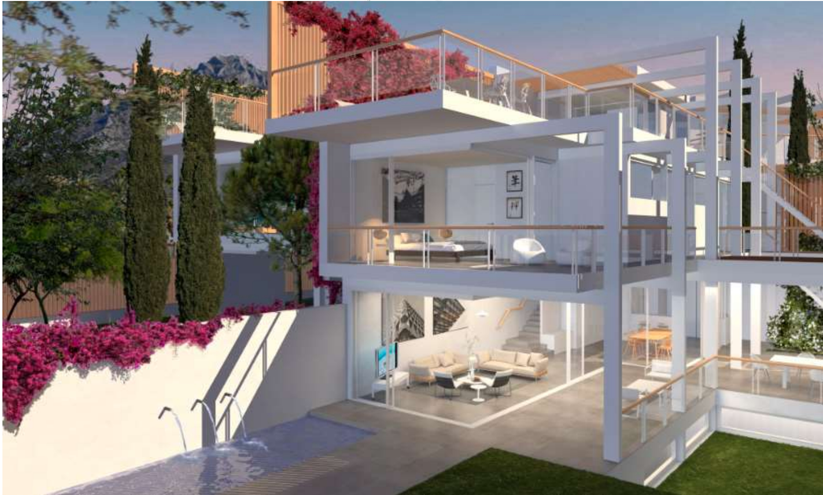
MEMORIA DE CALIDADES